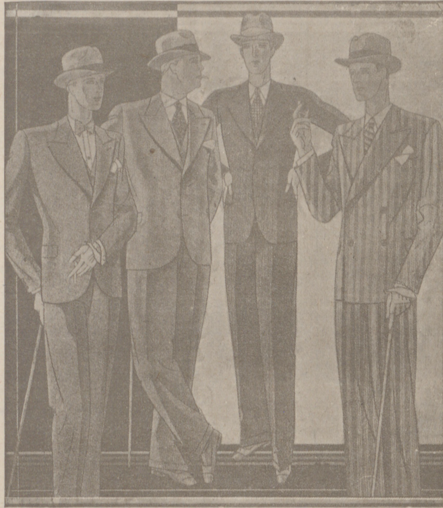
Trajes paño novedad desde 40 a 150 pesetas. — Corte moderno.

Casa Manguía Plaza Mayor, 42 Lain-Calvo, 9 y 11 BURGOS