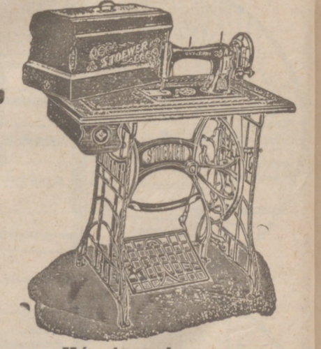
Máquinas de coser Doméstica para coser y bordar a precios antiguos, de 340 ptas. Alemanas.

PLAZA MAYOR, 42 LAIN CALVO 9 Y 11 BURGOS