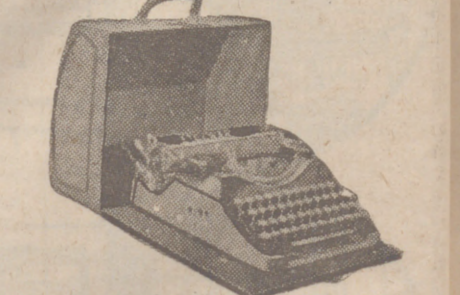
Máquinas de escribir Estuche, Marca STOEWER, a 600 ptas