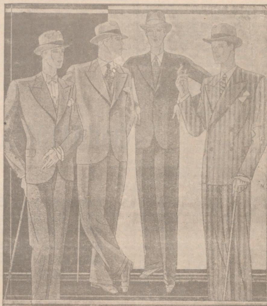
Trojes paño novedad desde 40 a 150 pesetas. — Corte moderno.

Plaza Mayor, 42 Lain-Calvo, 9 y 11 BURGOS