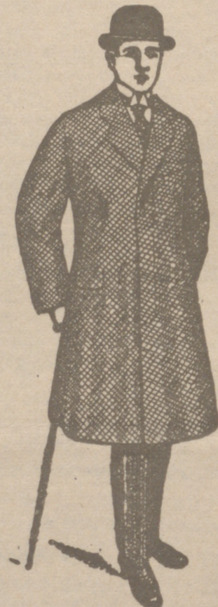
GABANES PARA CABALLERO a 35, 40, 50, 70, 90 y 100 pesetas

desde 20 a 100 pesetas La casa que más surtido tiene y más barato vende