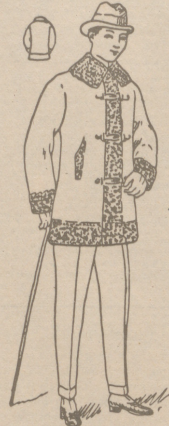
PELLIZAS DE PANO

PLAZA MAYOR, 42 LAIN CALVO 9 Y 11 BURGOS