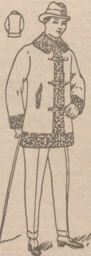
PELLIZAS DE PANO desde 20 a 100 pesetas La casa que más surtido tiene y más barato vende

PLAZA MAYOR, 42 LAIN CALVO 9 Y 11 BURGOS