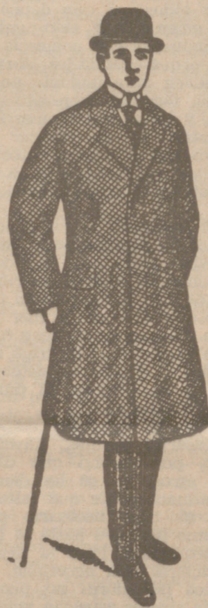
GABANES PARA CABALLERO a 35, 40, 50, 70, 90 y 100 pesetas