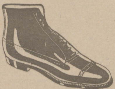
Botas en negro y color todo cosido a 19'50 pesetas EXPOSICION Y VENTA

Casa Manguía PLAZA MAYOR, 42 LAIN CALVO 9 Y 11 BURGOS