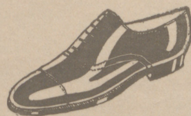
Zapatos en cinco colores distintos a 18 pesetas Zapato Charol, a 19'50

CALZADOS SEGARRA TODO COSIDO GOODYEAR Venta directa del Fabricante al consumidor