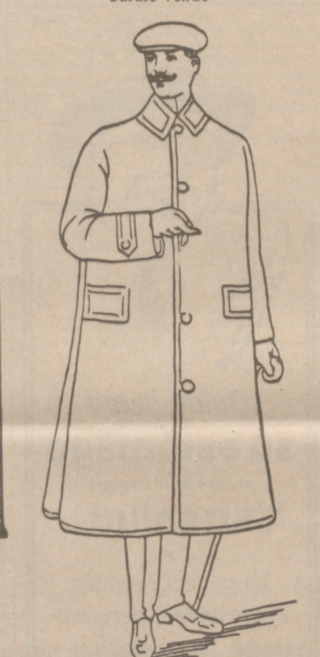
Impermeables negros o color, a 55, 40, 50 y 60 ptas. Trincheras, de 25, 30, 40 y 50 ptas. Pellizas paño, a 20, 25, 30 y 50 ptas. La casa que más surtido presente y más barato vende.

Si señor, Son tan excelentes los resultados que se obtienen para el desarrollo y engorde en toda clase de ganado con el acreditado producto Engorde Castellano Liras , que todo ganadero que lo emplea una vez para sus ganados, sigue usándolo. Especial para cerdos y aves. Venta: Farmacias y droguerías.