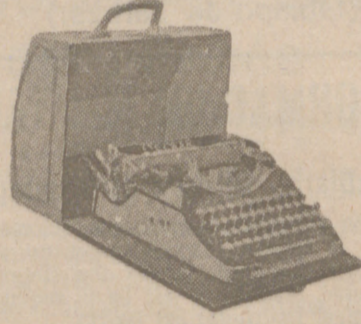
Máquinas de escribir