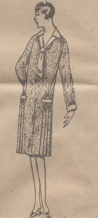
Vestidos de crepón, seda y en lana, colores novedad, a 20, 25, 30 y 40 ptas