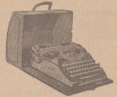
Máquinas de escribir

Doméstica para coser y bordar a precios antiguos, de 540 ptas. Alemanas.