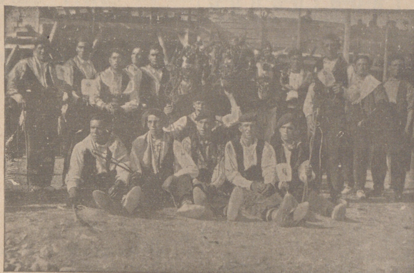
Típica cuadrilla de ramaleros en las corridas de toros de Aranda

Refiriéndonos a su labor ministerial, guarda de él buen recuerdo la Armada española al ver restituida la dignidad del almirantazgo. Concedió después el aumento de las dotaciones de embarco, que permanecían lo mismo que más de un siglo atrás. Inició también