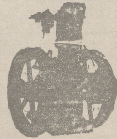
Forma la base de referencia de más de 8.000 motores instalados.

También publica otra real orden de Hacienda, disponiendo que con arreglo a lo prevenido en el artículo 138 de la vigente ley del timbre, todo documento que se utilice en las operaciones de giro esté comprendido en dicho artículo y sujeto a su escala de gravamen.