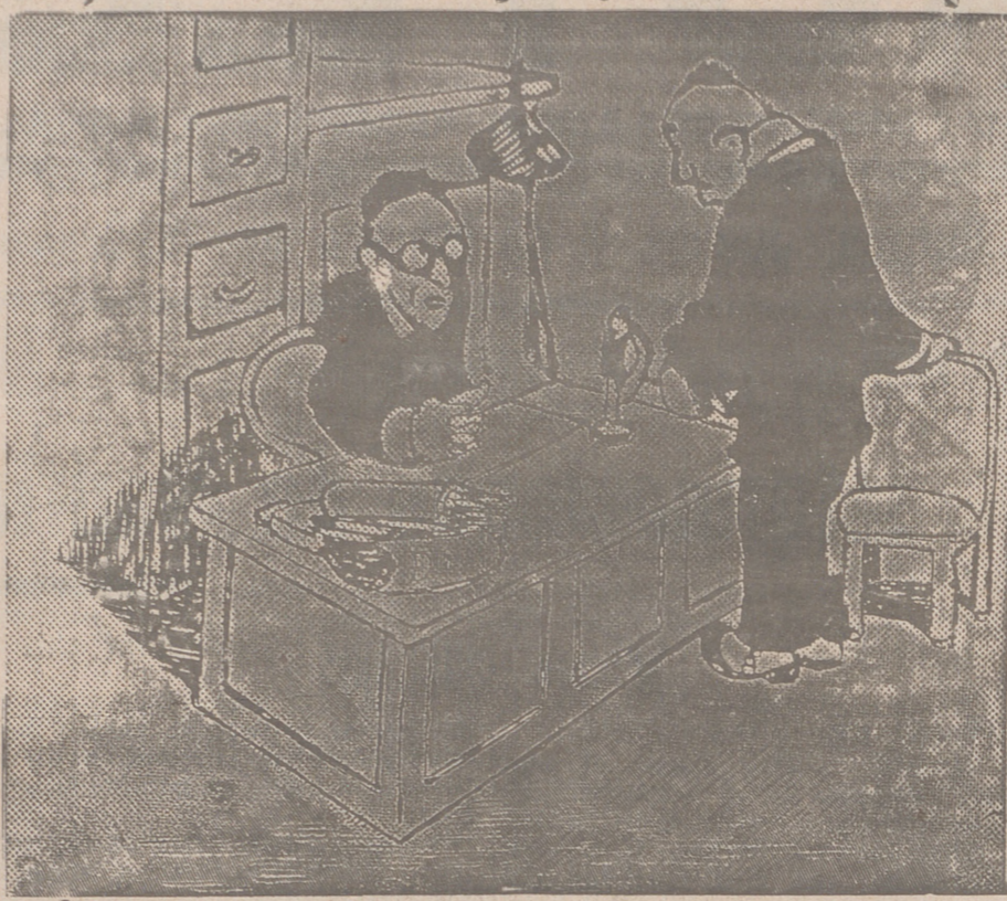
EN LA CASA DEL USURERO

—Escuche, señor: ¿Podría prestarme.... cinco minutos de atención? —¿Con mucho interés?