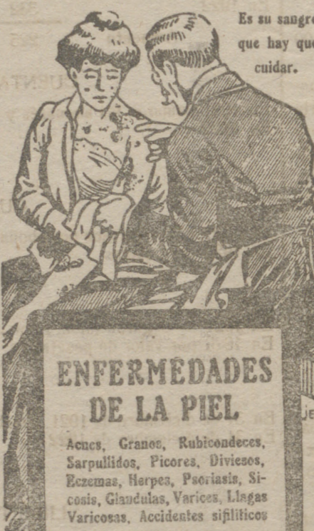
Es su sangre que hay que cuidar.

El 21 vapor España, 16 de febrero, vapor Bilbao, salida de Bilbao. Estos vapores están dotados de todos los adelantos modernos. Llevan MÉDICO, COCINEROS Y CAMAREROS ESPAÑOLES. También admiten carga para Rosario y puertos de la Patagonia. Para toda clase de informes, dirigirse al representante en Bilbao ED-MUNDO COUTO, Buenos Aires, 19, bajo. Teléfono 624. Dirección postal, Apartado 308. Telefónica COUTO.