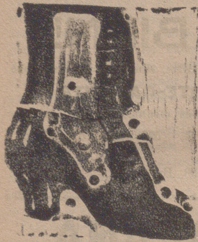
Gran surtido en todas clases, y sección económica a precios de fábrica.

En la Delegación del Comité del Nitrato de Sosa de Chile, Almirante 19, Madrid, se resuelven gratuitamente las consultas relativas a la aplicación de este abono, que se hagan por carta o verbalmente, y se envían folletos que tratan de la fertilización de los diversos cultivos que pueden interesar al agricultor español.