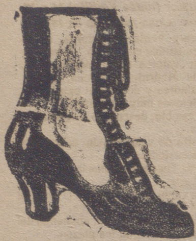
Gran surtido en todas clases, y sección económica á precios de Fábrica.

GRAN BAZAR DE CALZADO EMILIANO DOMINGO Merced, núm. 10.