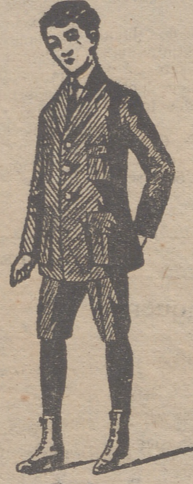
Trajecito dril, forma export á 20, 25, 30 y 35 pesetas