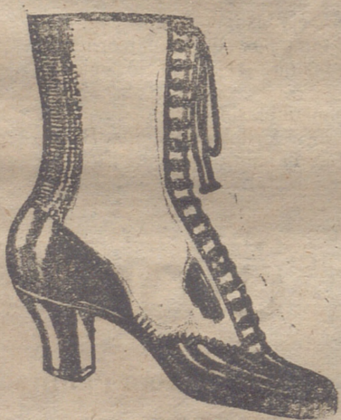
Gran surtido en todas clases, y sección económica á precios de Fábrica.

GRAN BAZAR DE CALZADO EMILIANO DOMINGO Mercado, núm. 10.