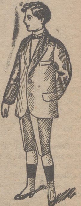
Traje de paño para jóvenes á 25, 30, 35, 40 y 50 pesetas.