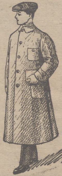
Guardapolvos de caballero y niños á 10, 12, 15 y 20 pesetas.