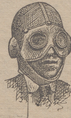
Cascos motoristas á 5 pesetas. Gafas á 5'50