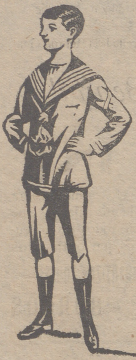
Trajecitos dril á 8, 10, 15, 20, 25 y 30 pesetas.

Primera casa que presenta grandes surtidos en ropas confeccionadas de caballero, señora, jóvenes, niños y niñas