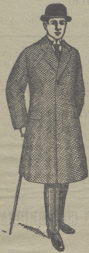
Gabanes de caballero desde 40 pesetas á 125.

Esta casa acaba de recibir grandes remesas en gabanes, pellizas, capas, mantillas de seda, capotes para el campo, impermeables para militar y paisano y pasamontañas de lana -