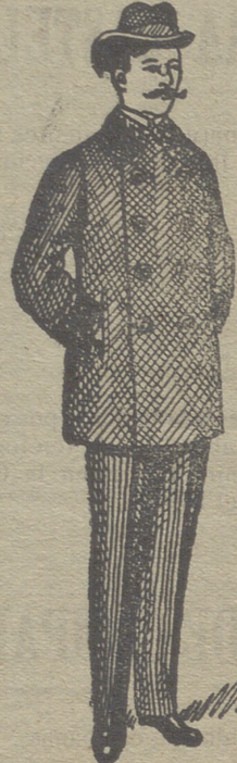
Pellizas desde 18 pesetas á 75.