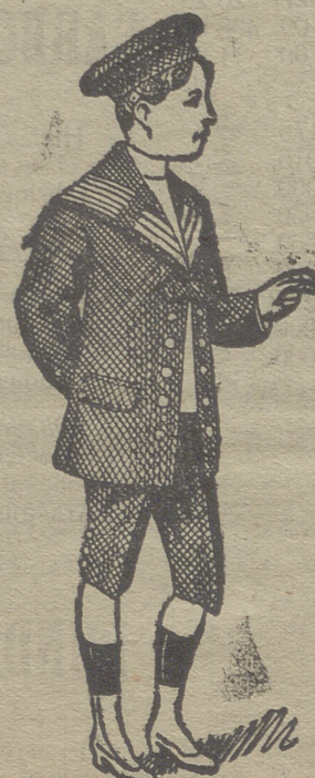
- 50 modelos diferentes - en trajecitos de niños, en gerga, paño y pana.