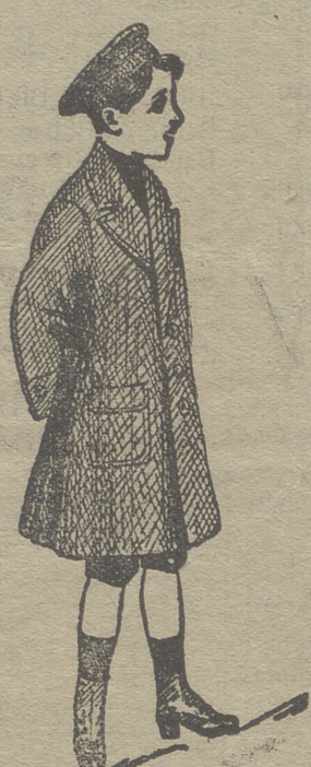
Grandes surtidos recibidos para la temporada en gabanes de jóvenes y niños