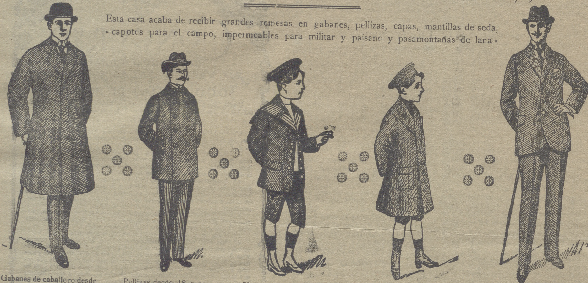
Gabanes de caballero desde 40 pesetas á 125

Esta casa acaba de recibir grandes remesas en gabanes, pellizas, capas, mantillas de seda, capotes para el campo, impermeables para militar y paisano y pasamontañas de lana.