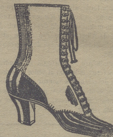
Gran surtido en todas clases, y sección económica á precios de Fábrica.

GRAN BAZAR DE CALZADO EMILIANO DOMINGO Mercado, núm. 10.