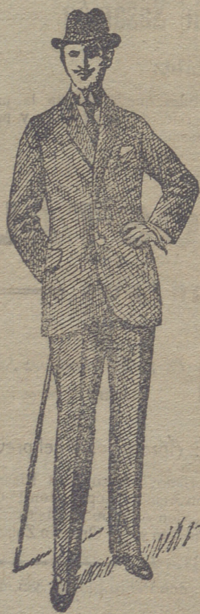
Trajes de paño de caballero y jovencito, desde 30 pese- tas á 75. En pana de 25 á 60 y en dril de 20 á 35.