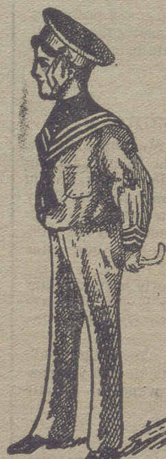
50 modelos diferentes en trajecitos de niños, en paño, vicuña, gergas y panas. Estos dos modelos son los últimos recibidos para la temporada.