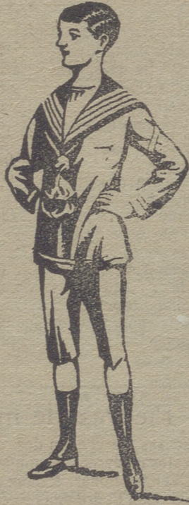
50 modelos diferentes en trajecitos de niños, de dril paño, pana, gergas, azules y negros.