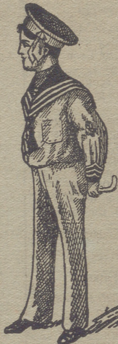
50 modelos diferentes en trajecitos de niños, en paño, vicuñas, gergas y panas. Estos dos modelos son los últimos recibidos para la temporada.