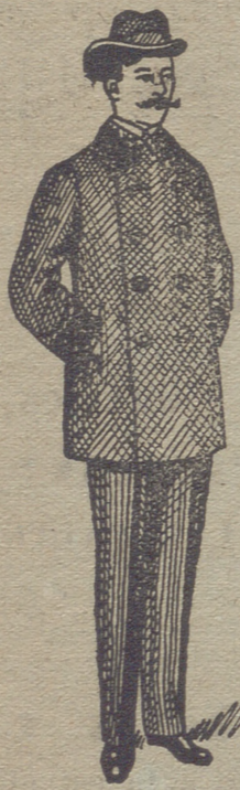
Pelizas desde 18 pesetas á 75.