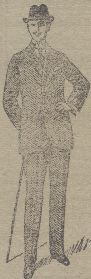
Trajes de paño de caballero y jovencito, desde 30 pesetas á 75. En pana de 25 á 60 y en dril de 20 á 35.