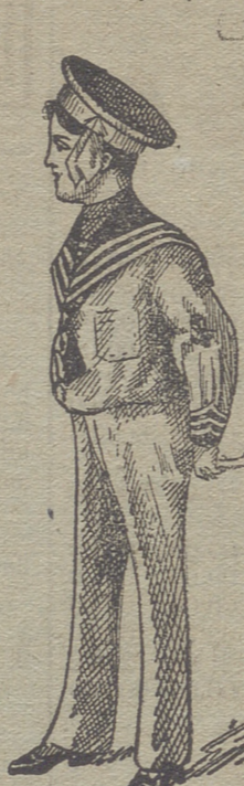
50 modelos diferentes en trajecitos de niños, en paño, vicuñas, gergas y panas. Estos dos modelos son los últimos recibidos para la temporada.