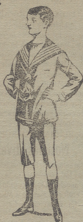
50 modelos diferentes en trajecitos de niños, de dril paño, pana, gergas, azules y negros.