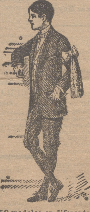
50 modelos en diferentes trajecitos de niño para primera comunión

Guardapolvos de caballero, señora y niño.