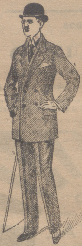
Trajes caballero de paño pana y dril

Esta casa presenta siempre grandessurtidos en trajes de caballero, joven y niños y espléndido surtido en toda clase de prendas sueltas para toda clase de trajes.