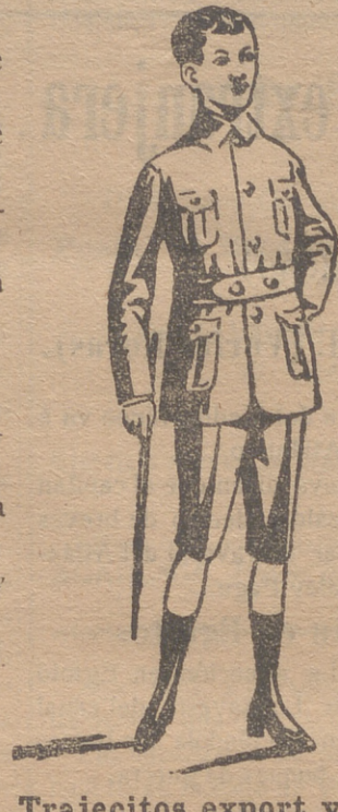
Trajecitos export y ra. forma corriente en paño, paña y dril.

En blanco hay bonitos modelos para la Sgda. Comunión y lazos para lo mismo.