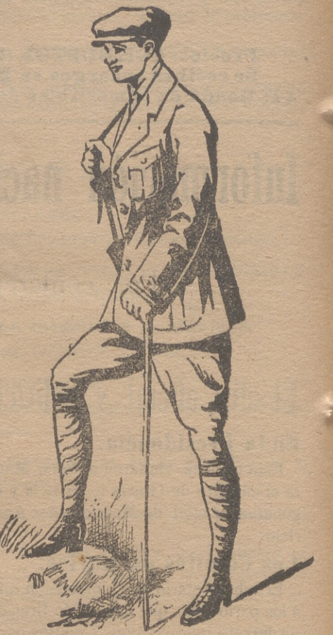
Trajes export en paño, dril y pana.

Grandes surtidos en lanería y pañería de caballero y seño