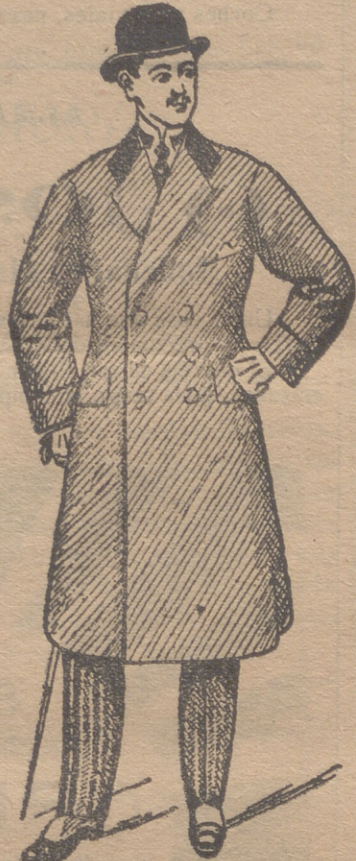
Abrigos gabardina desde 80 ptas. á 150 ptas.

Esta casa presenta siempre grandessurtidos en trajes de caballero, joven y niños y espléndido surtido en toda clase de prendas sueltas para toda clase de trajes.