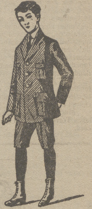
Trajes de jovencitos forma export y corriente en paño, pana y dril.

de señora y niños, corsés, medias en gasa, seda hilo y algodón, toquillas pelerinas en pelo cabra y lana. Lanería y pañería para señora, paños patentes y panas para caballero