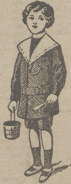
50 modelos diferentes en trajecitos de niños en paño gerga y pana.

pas, mantones, mantillas de seda, tapabocas, mantas de Palencia, género de punto paraguas, guantes, gorras, botinas, calcetines ligas, tirantes, cuellos cauchut, piqué y plancha.