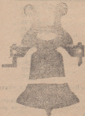
Campana con yugo de hierro de una sola pieza

Pueden adaptarse á cualquier forma á peso de campana sin necesidad de bajarlas de la torre. Se garantiza por 10 años.