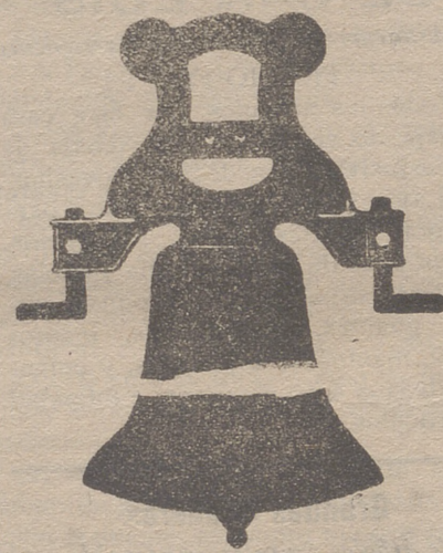
Campana con yugo de hierro de una sola pieza

Gran diploma de honor y medalla de oro en la Exposición Hispano-Francesa de Zaragoza en 1908 Calle de Francia y Portal de Urbina VITORIA (ALAVA)