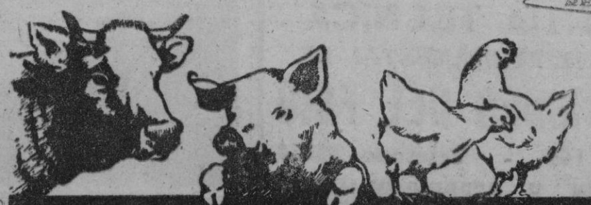
Archivo Publicitario LAB. REUNIDOS

ES UN PRODUCTO CON LA GARANTIA DE AMERICAN Cyanamid company