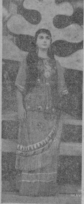
Paola Mantovani, gran mezzo-soprano italiana, que intervendrá en «Aida» y «Carmen», en la próxima temporada de ópera.

La magnífica «Sociedad de Opera de Mallorca», pasa otra vez al primer p año de nuestra vida musical. Su próxima temporada, casi ya inminente, promete constituir otro acontecimiento artístico-social, añadiendo un nuevo lauro a la serie de éxitos alcanzados en pasadas actuaciones.