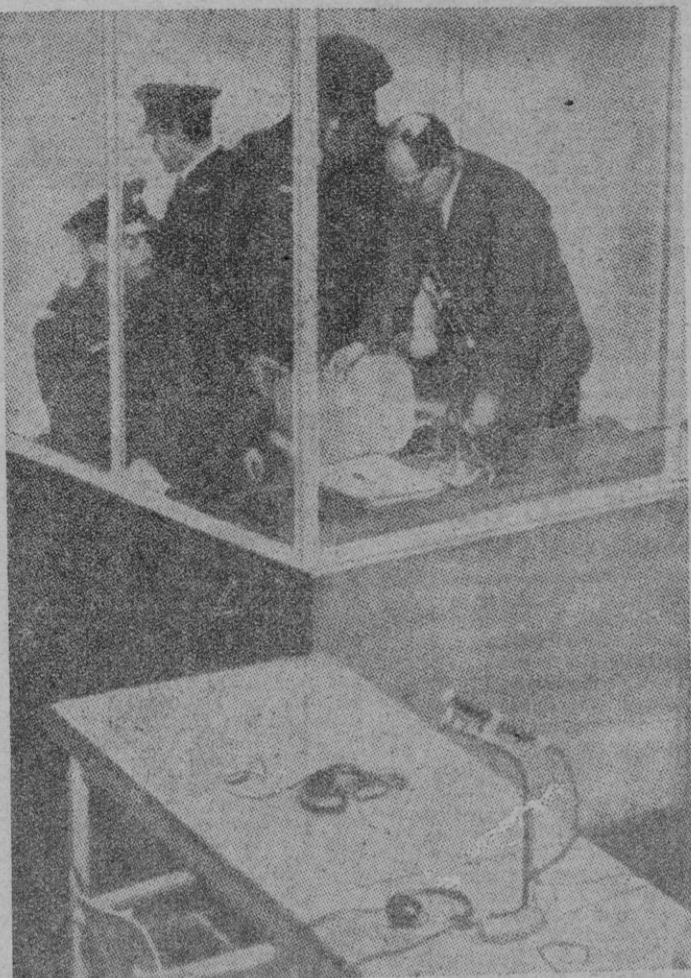
Eichmann entra en la cabina de cristal y se dispone a tomar asiento. Una vaga sonrisa iluminaba su rostro, de ordinario impenetrable. El procesado escuchó de pie, en posición de firmes, la breve declaración del Presidente del tribunal declarándole culpable. Después de doce horas de sesión, interrumpida por breves descansos, el rostro de Eichmann estaba marcado por leves rictus, en los que se acusaban la fatiga y la preocupación.

Jerusalén (Crónica de la Agencia Efe, transmitida por teletipo, por Aryé Wallenstein, exclusiva para «BALEARES»). — A las ocho de la mañana del viernes, Adolfo Eichmann habrá comparecido nuevamente ante sus jueces, esta vez para escuchar la sentencia, que —según la opinión más generalizada— ha de ser condena a muerte. En círculos allegados al tribunal se cree que la sentencia será expresada con los siguientes seis vocablos hebreos: «Beit din zeh tan otzha llemita» (El tribunal le condena a muerte). Con arreglo a las leyes de Israel la sentencia será cumplida por el sistema de horca y se llevará a cabo en el interior de la prisión, ya que en Israel los ajusticiamientos no son públicos. El comisario de la prisión me ha declarado que el Estado ha rechazado todos los ofrecimientos que se han recibido del país y del extranjero —procedentes en su mayoría de supervivientes de campos de concentración «nazis»— para prestarse voluntarios a ahorcar al ex Teniente Coronel de las S.S. Eichmann, acusado de ser responsable de la muerte de millones de judíos, ha sido declarado culpable de 15 acusaciones formuladas contra él; acusaciones que llevan implícita la pena de muerte en 12 casos. Ayer por la tarde el acusado declaró: «Debo aceptar la suerte que me impone el destino», lo cual parece indicar que no está dispuesto a recurrir. Según los funcionarios de la prisión, Eichmann pasó tranquilo toda la noche en su celda.