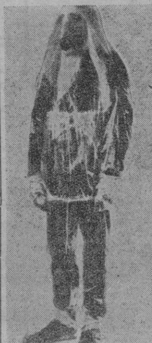
En San Luis, Estados Unidos, se exhibe ahora este modelo de equipo contra la lluvia radiactiva. Es un modelo más entre tantos otros de los confeccionados por el hombre contra el temor de las explosiones nucleares. Esta acaso sea la vestimenta del futuro.