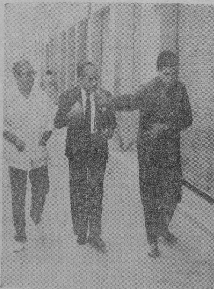
Curro Ortuño, famoso novillero alicantino y que convalecía de una gravísima cogida durante una novillada el pasado día 16 en Valladolid, se fugó del Sanatorio de Toreros madrileño en pijama y bata provocando un revuelo no sólo en la Clínica sino en todo Madrid. Horas más tarde e indiferente a todo y sin poder explicar las causas, el extraño y extravagante novillero apareció como si tal cosa. Parece ser que ideas obsesivas le persiguen. A esto se llama «espantá» aunque sin toro. En la foto: Curro Ortuño llega al Sanatorio de Toreros ante el asombro y la indignación de su apoderado.