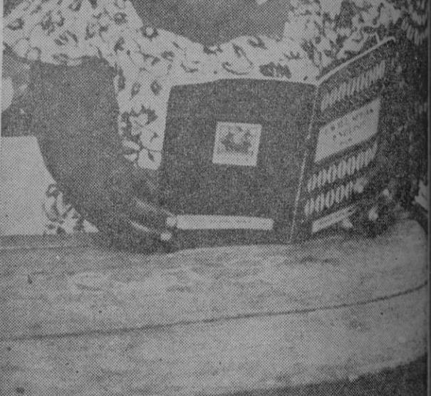
La Unión de Mujeres Togolesas ha organizado clases de literatura e inglés para sus miembros. En la foto, la profesora de inglés, en una clase improvisada, durante su lección.