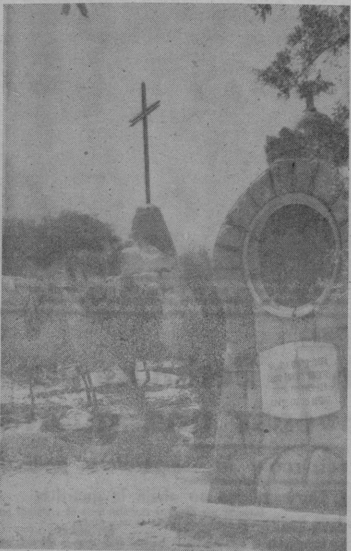
Uno de los temporales del pasado año derribó la Cruz de los Misterios, existente en el Santuario de Lluch. Estos días se ha procedido a la instalación de la nueva cruz y mañana, en el transcurso de solemnes actos, se procederá a la bendición de la misma, así como también a la bendición de la línea eléctrica.