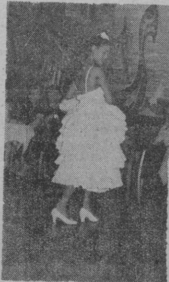
«La Chunga» baila su noche de bodas.