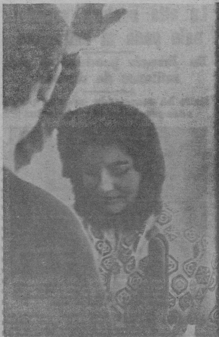
Kitzbühel, Austria. — La ex-emperatriz Soraya de Persia se encuentra desde hace algún tiempo en esta elegante localidad thermal disfrutando de los deportes de nieve. Dentro de poco se reincorporará a la firma inglesa de automóviles que ha contratado sus servicios.