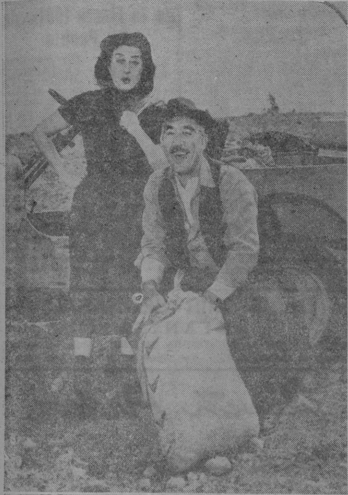
Una de las escenas de «Viento Salvaje», que tiene como protagonistas centrales a Anna Magnani y Anthony Quinn.

«Viento salvaje», la última que ha dirigido