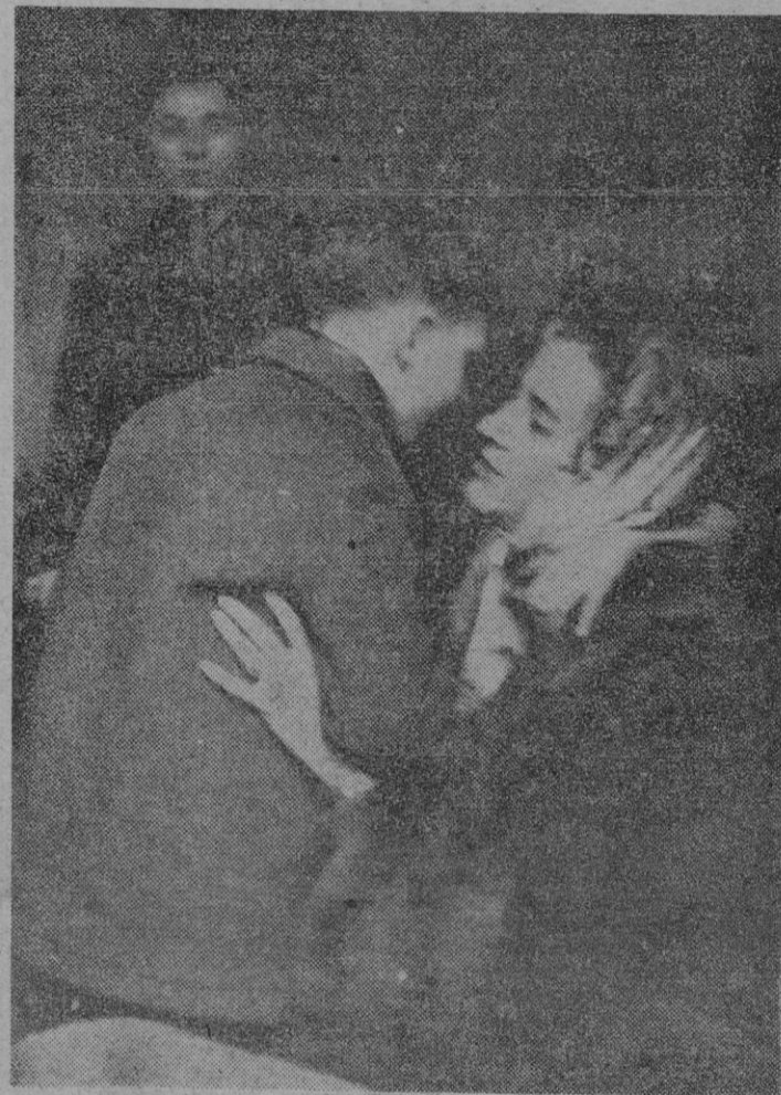
La Reina de Bélgica, Fabiola, abraza, emocionada, a un niño que perdió a sus padres en la catástrofe de Moulins-sur-Féron, donde varias viviendas quedaron sepultadas a consecuencia del deslizamiento de un montón de escombros.