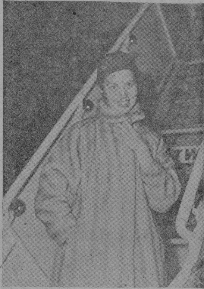
Guardarse del frío es muy importante

Crece cada vez más la alarma en la OMS, (Organización Mundial de la Salud), por el abuso tan desconsiderado que se hace de la codeína. Como es sabido, éste alcaloide se obtiene, igual que la morfina y la papaverina, del opio. Pero mientras que el uso de la morfina es muy restringido y el de la papaverina se limita al tratamiento de los espasmos de la musculatura de fibra lisa, la codeína se emplea a la menor dosis, ya que tiene la virtud de calmar la tos por su acción paralizante. Esto trae consigo el que aumente el consumo mundial de opio, lo que llena de alarma a