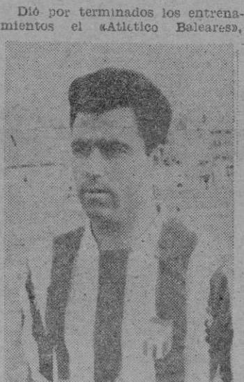
CINTAS una vez cumplida la sanción reaparecerá