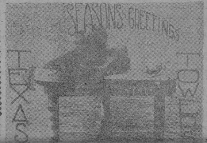
Tarjeta de felicitación de Pascuas enviada las pasadas Navidades por un miembro perteneciente al servicio de la torre de radar desaparecida y en la cual figura retratada la misma.

El accidente de la plataforma de radar nº 4 de la Marina norteamericana, instalada en el Atlántico a 83 millas de Nueva York, traerá una larga cola. A medida que se van conociendo detalles no ya de la catástrofe en sí, sino de los días precedentes, así como la opinión de los técnicos, se va levantando una ola de comentarios que llegan hasta el extremo de acusar de negligencia a las autoridades de la marina, que