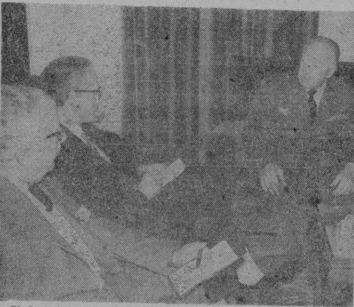
El General Jefe de la Zona Aérea de Baleares, dando cuenta a los informadores de la desaparición del «Heinkel».