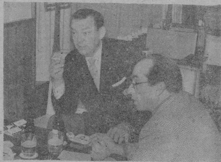
El artista de la T. V. sueca, Aake Grönberg, durante la entrevista.

—¿Por qué? —Porque se gana mucho más y porque se trabaja ante varios millones de espectadores. —¿Cómo empezó su carrera artística? —Debuté como barítono en revistas y operetas. Pero pronto me sentí atraído por el arte dramático