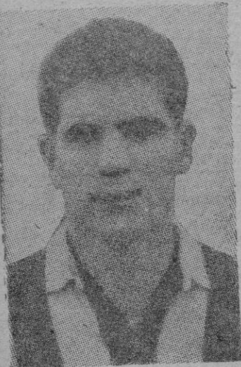
POLO máximo goleador en la jornada del pasado domingo al marcar tres goles

Las Peñas del Mallorca, dispuestas a hacer acto de presencia en el «Luis Sitjar», animando Ya sube el barómetro del optimismo y empieza a verse la posibilidad de un triunfo claro