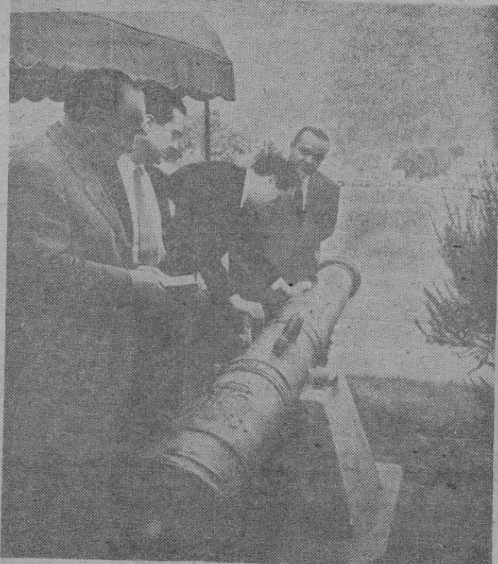
Los periodistas españoles examinan cañones de la época colonial en la antigua fortaleza española en San Francisco de California, que es ahora el cuartel general del Sexto Ejército de los Estados Unidos.

Volando sobre suelo norteamericano se observan los informes y dilatados comentarios de autos. Pero de haber también comentarios de muebles, de pianos, de