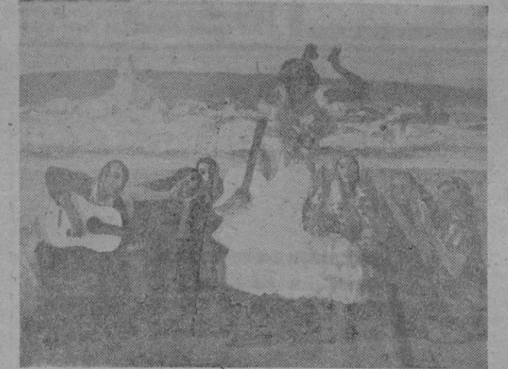
Boceto para el cuadro «El tango de la Corona»

biografía extensa, y artículos de numerosos académicos y críticos de arte, los más importantes del momento. Lo encabeza un artículo del propio Anglada, de entrañable sig-