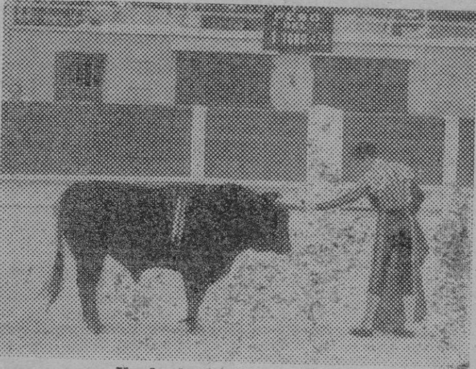
Un desplante de Jaime Ostos.