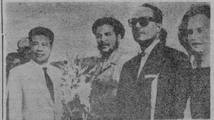
Llegó a la Habana, procedente de su país, una misión comunista china, presidida por el viceministro de Comercio, quien aparece en la «foto» junto a «Che» Guevara.