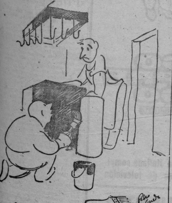
—Le he pintado el mostrador a dos colores: una parte para los cuartos de ternera, sobrasadas, lomos... etc., y la otra para las guarniciones, guisados, panadería...