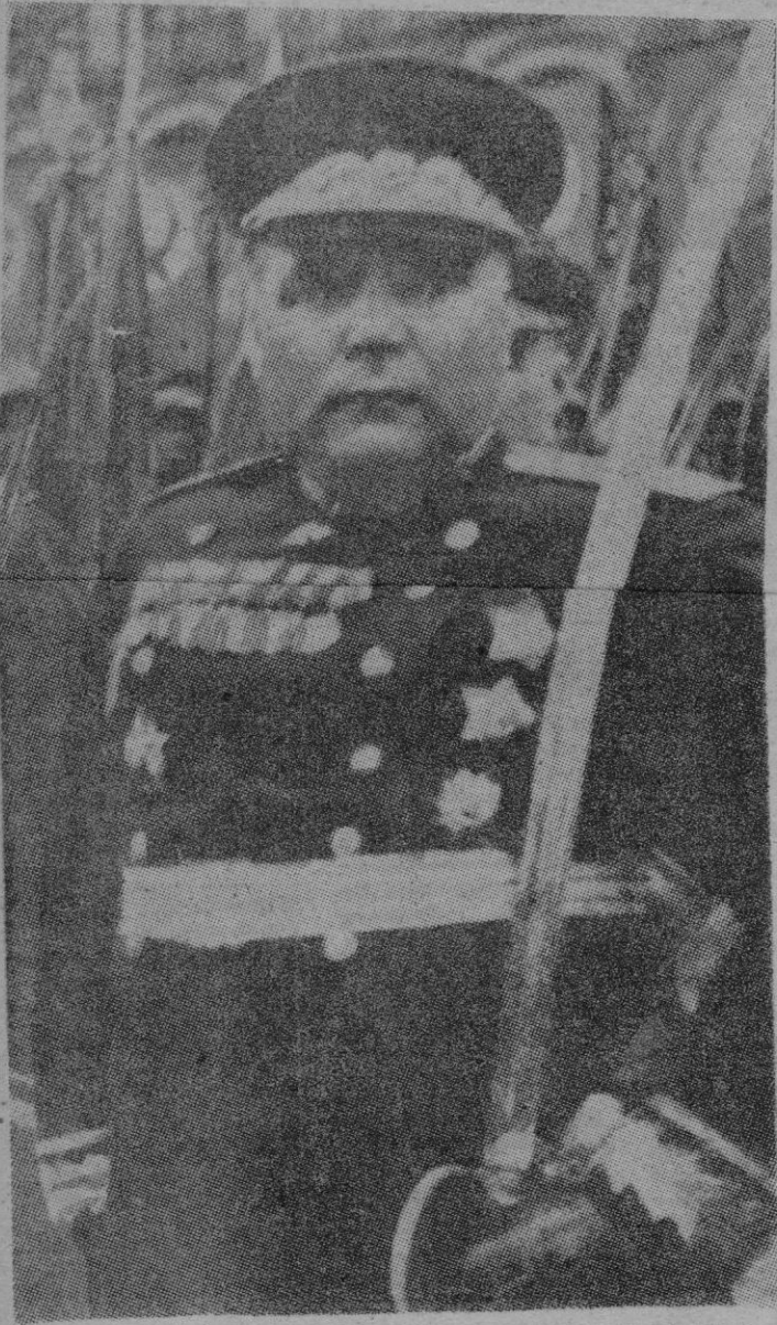
El Mariscal Malinovsky; en Rusia y en el Ejército Rojo todo está tranquilo.