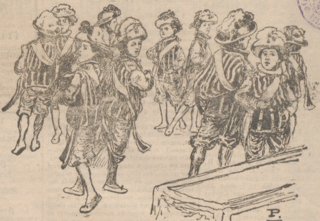
Apunte del cuadro de Gonzalo Bilbao, que respresenta el baile de los “seises.”

ambiente que la rodea y el lugar que le sirve de marco. Es bajo grandiosas bóvedas.