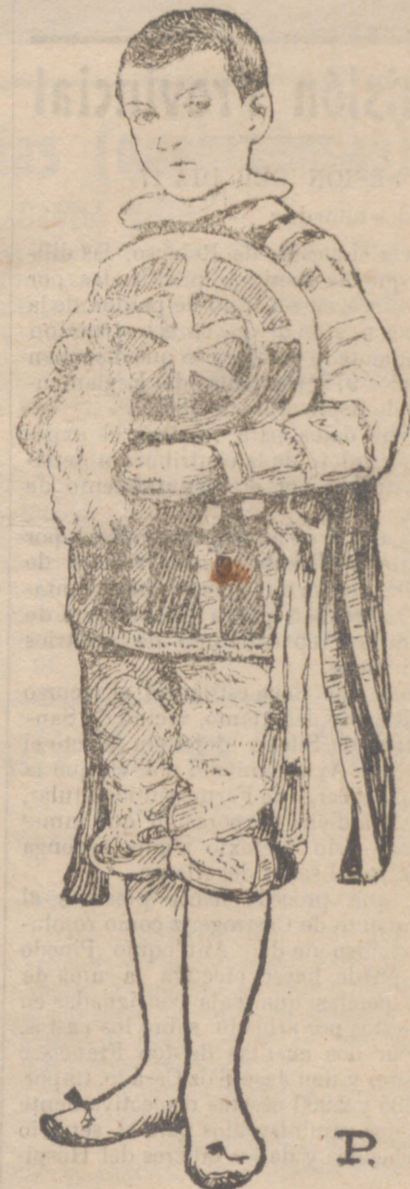
“SEISE” CON EL TÍPICO TRAJE QUE USA EN LAS SOLEMNIDADES