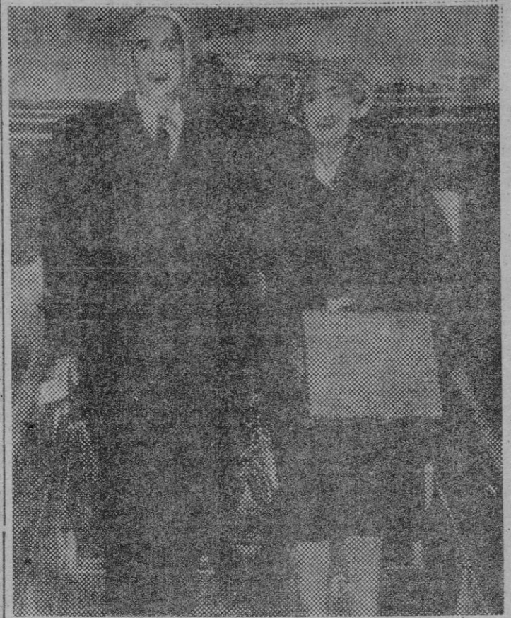
Hoy se celebra en Estocolmo la solemne ceremonia de la entrega de los Premios Nóbel. El doctor Ochoa y su esposa llegan a la capital sueca para recibir el galardón de Medicina.