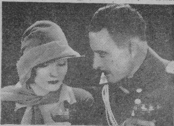
Ana Karenina, de la pareja Greta Gargo y John Gilbert. (John Gilbert sería, rechazado por Greta, con quien estuvo a punto de contraer matrimonio).