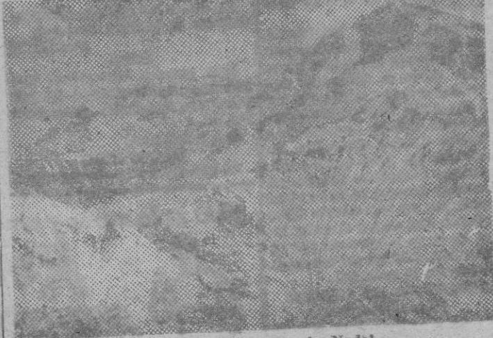
«Paisajes», óleo de Ramón Nadal.

artista. Ahora Nadal, insistiendo en la preferencia, apuntada en anteriores exposiciones, emplea la paleta exclusivamente y juega con la pasta, con la sabia y justa posición de los toques, con los efectos de las mezclas, apenas insinuada, y en fin, con un perfecto