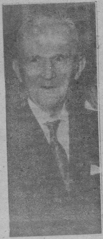
Una foto del gran almirante Doenitz, obtenida al salir de la cárcel de Spandau. El famoso marino, en su libro de memorias, hace una dura crítica de la estrategia continental de Hitler.

la verdad de los hechos. En este sentido, en su sencillez y claridad periodística —por así decirlo, de periodismo ejemplar—, las Memorias del Almirante son de un interés que no decae en una sola de las quinientas y pico de páginas que integran el libro. En sus relatos, Doenitz emplea, además de los datos fidedignos, el arma de la templanza, y así el libro es un constante enjuiciador de acontecimientos y personas dentro de un gran cuadro de serenidad, de comprensión. El amor a sus servidores, a los marinos y cola-