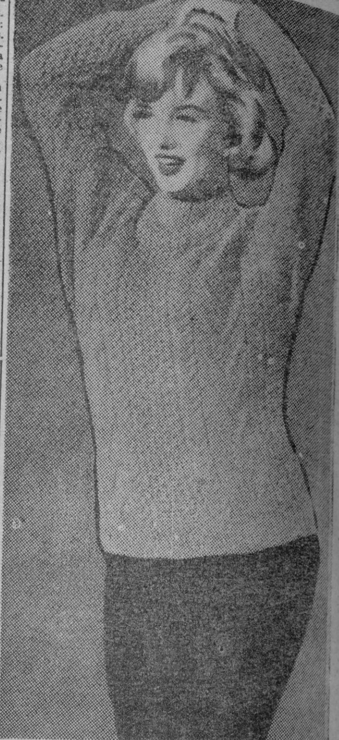
Rara vez habíamos visto a la superfamosa Marilyn Monroe retratada con tanta ropa encima. La explosiva «vamp», echándose las manos a la cabeza, parece decir a los que la miran: «Para que veais que todo me sienta bien, me ponga lo que me ponga.» Y es verdad: Hasta en sueter, hecho por sus propias manos, está atractiva la señora Miller.