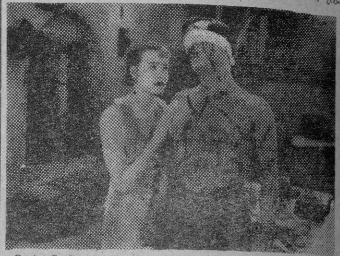
Greta Garbo en «La tierra de todos», con Antonio Moreno, uno de sus primeros grandes triunfos en Hollywood.

EL CINE SONORO Llegó el cine sonoro, y todo el mundo se preguntaba si esta artista tan enormemente expresiva por el gesto y la mirada daría resultado. Por otra parte, ¿co-