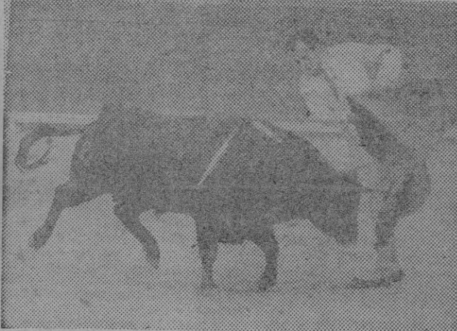
Un recorte de muleta de Aparicio

jones excelentes. Pero al aparecer en el ruedo el maravilloso caballo «Ruiseñor» fue cuando la actuación del notable jinete sevillano adquirió el mayor esplendor tanto en el novillo que abrió plaza como en el que la cerró. Clavó tre smagníficos pares de banderillas en todo lo alto, después de una magistral preparación con remolinos y espectaculares saltos de carnero. Continuó con su extenso reper-