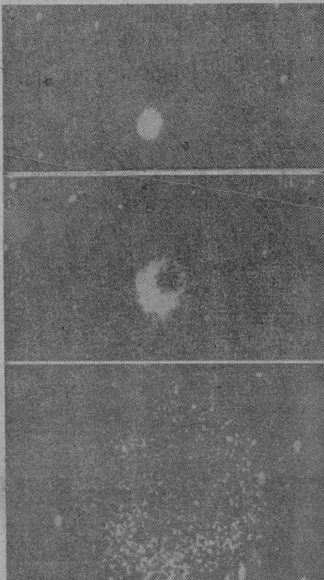
En estas tres fotografías recibidas por radio, se registran tres fases del rastro dejado por las nubes de vapor de sodio, de color amarillo-verdoso emitidas por el cohete ciudadano de la Luna.