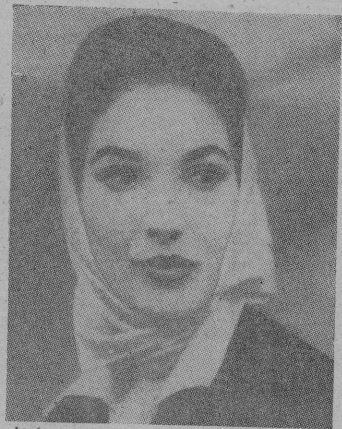
La famosa diva Maria Callas a su llegada a Bilbao

en el sentido de que no existen lazos sentimentales entre él y la diva, sino unos lazos de buena y sincera amistad que le obligan a prestarle toda la ayuda posible en las desavenencias de la soprano con su esposo el señor Meneghini. Eu cuadro está completo. El esposo de la Callas y la mujer, de Onassis viajan por el mundo, cada cual por su lado, encerrados en un mutismo integral. La Ca-