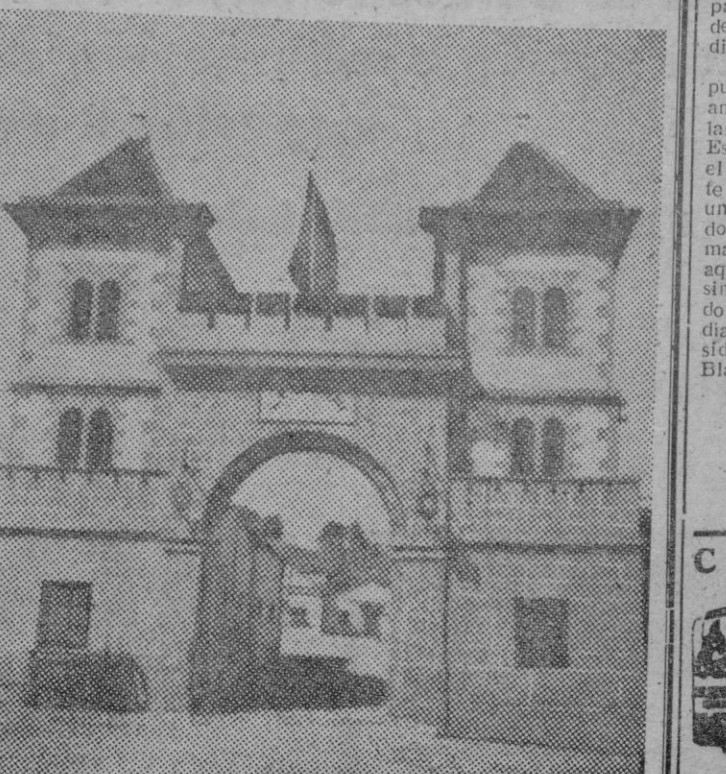
Dar Riffien, puerta principal de entrada del acuartelamiento

«EL DIABLO» ex-Legionario de la 5.ª Bandera