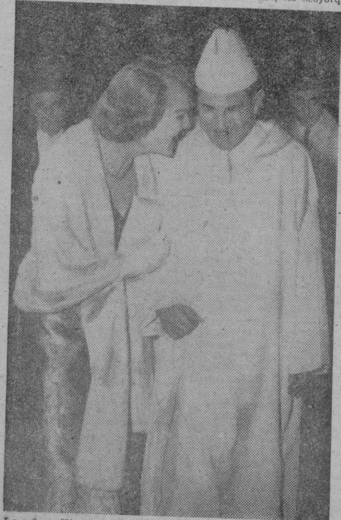
La señora Nixon traba amistad con Mohamed V, durante una recepción oficial.

lares. Luego amplió el "negocio" con la cría de pollos y gallinas; con el dinero que obtenía se pagaba los estudios, pues siempre había tenido una gran afición a las letras. Escogió una profesión corta y se hizo enfermera. un día leyó que en un hospital neoyorqui-