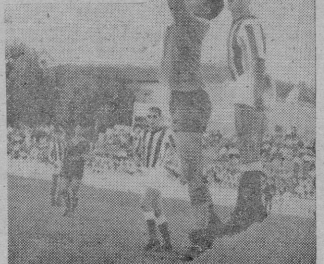
El meta Terrasa, del Binisalem, tuvo una buena actuación. Aquí le vemos deteniendo un balón que iba a rematar Beltrán, ya convertido en interior.