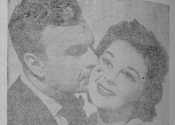
Un primer plano de Susan Hayward y Richard Conte, intérpretes de la película «Mañana lloraré», que el próximo viernes se estrenará en el circuito de los cines «Sala Augustas» y «Salón Rialto» y por la cual hay gran expectación entre los aficionados al cine.