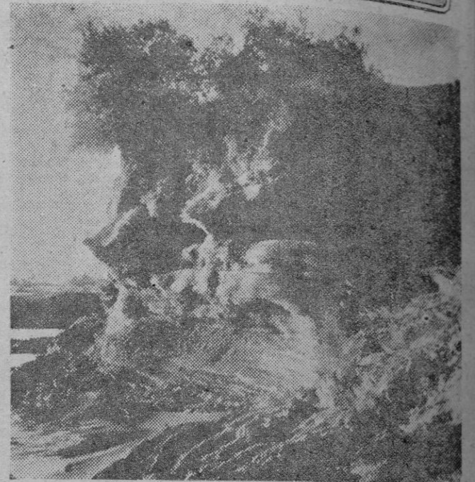
El fuerte y original paisaje de la selva

Un estrecho y mudo abrazo selló las palabras de Montandon. Los ojos de Loys —ojos duros, acostumbrados a interrogar de frente las enigmas de la tierra y desafiar los peligros, vinieran de donde vinieran— estaban húmedos.