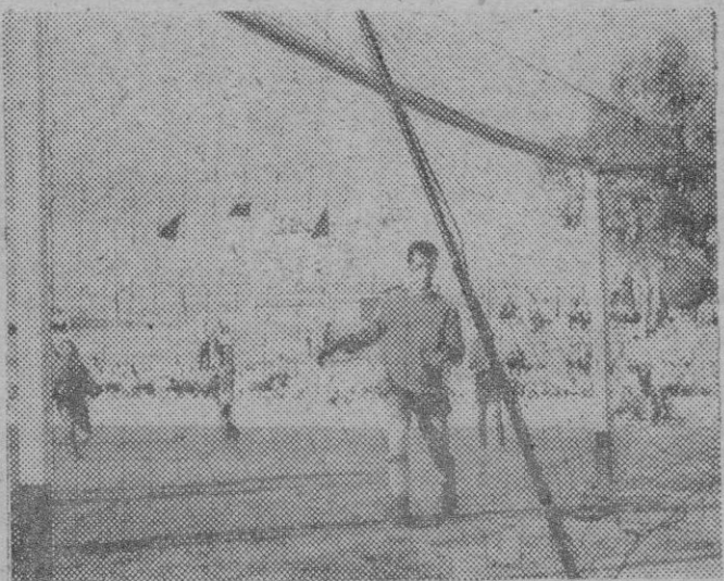
Sólo un gol se marcó en el primer tiempo. Su autor fue Ramoncito.

Asomos de dureza y táctica defensiva de los visitantes