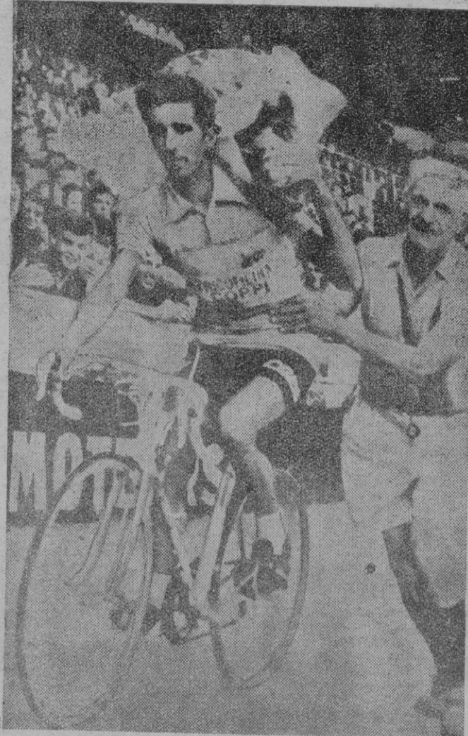
El vencedor de la Vuelta Ciclista a Francia, Federico Martín Bahamontes, dando la Vuelta de honor al velódromo parisiño.

He de aclarar que el interesado, Bahamontes, no escuchaba tal conversación ni sabe nada de ello, por que todavía se ignora si Bahamontes firmará por «Tricou» Coppi.