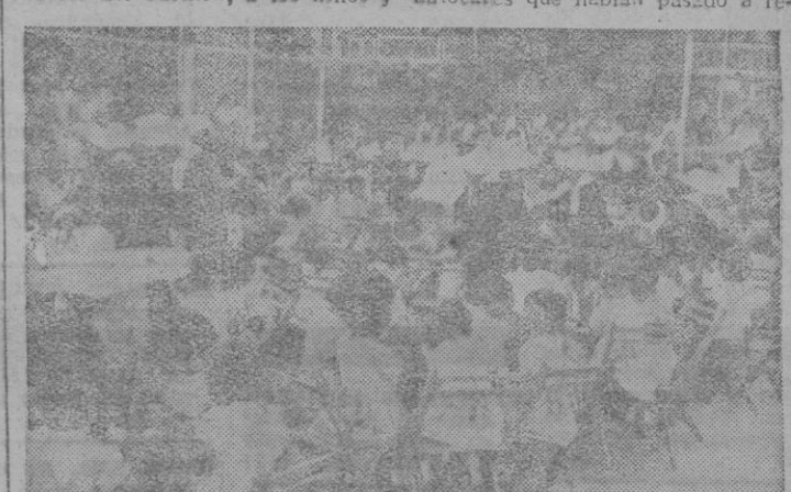
Un momento de la fiesta infantil del domingo, celebrada con motivo de la Fiesta del Carmen

El II Festival infantil constituyó un resonante éxito. Muy hermosa y particularmente emotiva fue la fiesta infantil, celebrada el domingo por la tarde, dedicada por la Comisión de las Fiestas del Carmen, a los niños y niñas de los asilos de Palma. Como el año pasado, este II Festival Infantil fue honrado por la presencia, entre otras distinguidas personalidades, del Alcalde de Palma D. Juan Massanet.