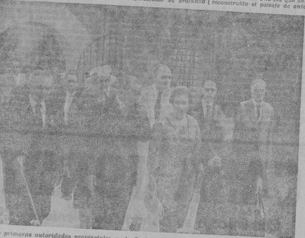
Las primeras autoridades provinciales en la Casa-Museo «Fray Junípero Serra».

Porque pocos monumentos podrían mejor servir como demostración de esa unidad espiritual que este Museo y Centro de Estudios «Fray Junípero Serra».