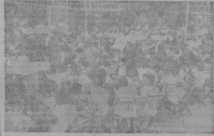
Un momento de la fiesta infantil del domingo, celebrada con motivo de la Fiesta del Carmen