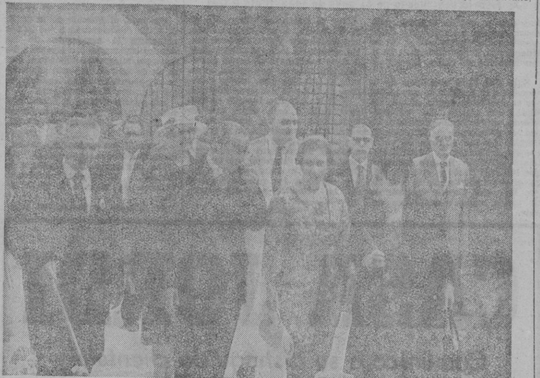
Las primeras autoridades provinciales en la Casa-Museo «Fray Junipero Serra».

Porque pocos monumentos podrían mejor servir como demostración de esa unidad espiritual que este Museo y Centro de Estudios Fray Junipero Serra.