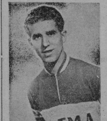
Bahamontes, está rodando bien en este principio de temporada

A continuación se clasificaron: 2.—Bahamontes, mismo tiempo 3.—Moser, (Italia), id. 4.—Aru (Italia), 6-2-22. 5.—L. Bobet (Francia), id. 6.—Fantini, (Italia), id. 7.—Nencini (Italia), id. 8.—Van Looy (Bélgica), id. 9.—Borra (Bélgica), 6-4-50 10.—Conti (Italia), 6-5-9.