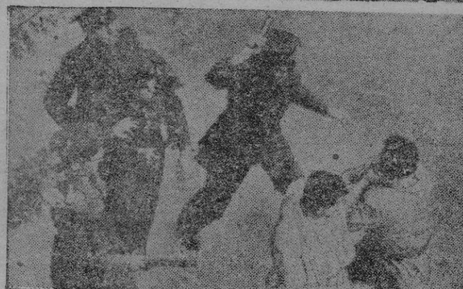
La paz de Chipre, en los últimos tiempos, se ha visto muy malograda.

me dice señalando hacia un rincón del bar: