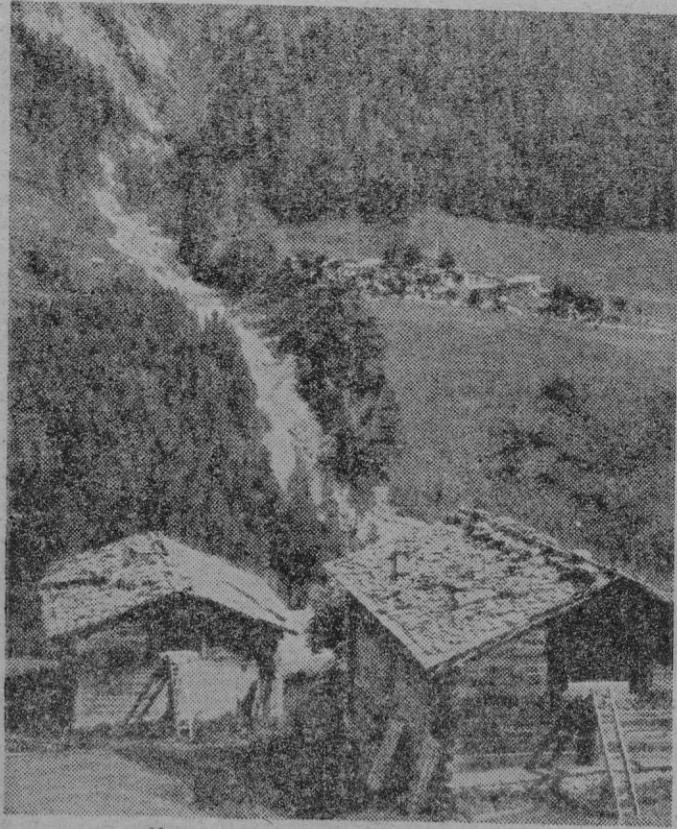
Una característica vista suiza

(Servicio especial de F.Y.R.E.A.) —De Madrid a Barcelona todo fue bien, excepto la inintermitente charla de dos señoras que utilizaron, durante las trece horas que duró el viaje, todos los idiomas que habían aprendido y eran bastantes, y que no hicieron más pausas que la de encender cigarrillos. Llegamos a Barcelona aproximadamente a las doce. El tren para Fort-Eou, frontera española con Francia, salía a las cinco de la tarde. Hasta ese momento tuve tiempo de trabar amistad con una simpática muchacha italiana que volvía a su país entusiasmada de España y con un muchacho que iba a Ginebra a visitar a su novia. Charlamos un poco de todo y a las cinco de la tarde salimos juntos para Port-Bou. A las siete