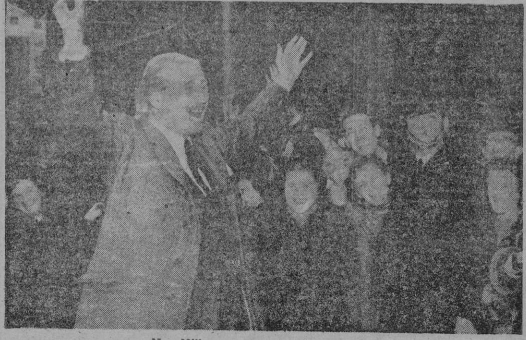
Mac Millan en una expresión optimista.

portancia de los coloquios personales de Mac Millan con Khrushchev sólo podrá valorarse después del viaje". "Logrará Mac Millan su noble propósito, de "tratar de disipar los malos entendidos y sentar las bases para una mejor comprensión?" C. A. P.