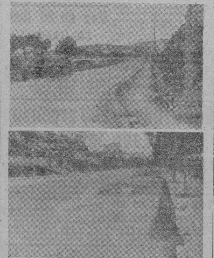
Los aspectos de las obras en curso de la nueva alineación de bordillos de las aceras del Paseo Marítimo

sigue cuidada con cariño y con interés. El Paseo Marítimo, orgullo de los mallorquines, va a más, alcanzado con las pausas necesarias, una mayor perfección en cuidados y detalles que le convertirán en lo que todos hemos soñado