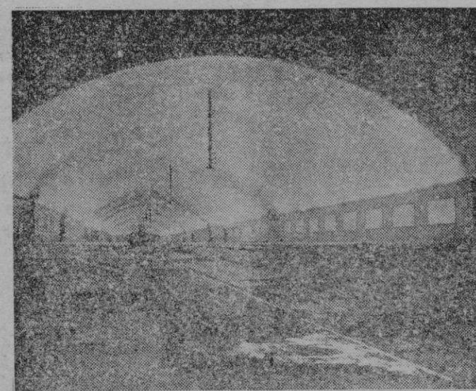
Con sus 320 metros de longitud y sus dos inmensas bóvedas de 20 metros de luz, la estación del metro madrileño, recién construida junto a los nuevos Ministerios, pasa a ser la mayor estación subterránea del mundo. Ni que decir tiene que la nueva estación conocida por «Nuevos Ministerios» está dotada de un completo servicio de ascensores, escaleras automáticas y otras instalaciones modernas. Como estación de tránsito, está destinada a unir las líneas ferroviarias del Norte con las de Mediodía y Oeste.