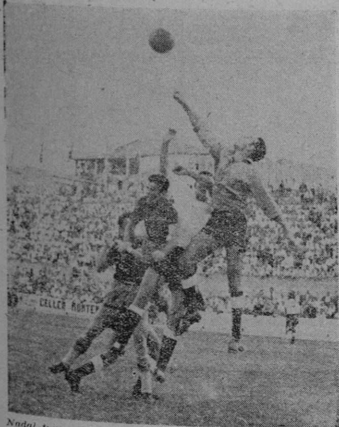
Nada! tuvo algunas intervenciones acertadas, como la de la foto, en la que aparece despejando un balón peligroso para su meta.

Ahora bien. Estamos comentando un caso concreto. Un encuentro entre el Mallorca y el Constancia en el que la mejor técnica de juego le pudo a la fortaleza física y al mayor esfuerzo, pero se inclinó siempre la balanza hacia este lado? Serán capaces los decanos de mantenerse una o otra vez aferrados a su sistema sin declinar un apice hasta lograr el vencimiento del adversario? Creemos que mientras en el centro del campo permanezca en calidad de «director de orquesta» el extraordinario Lorenzo, todo ello será posible, pero nos tememos que el día que faltará este, faltará una pieza muy importante (Continúa en pag. once)