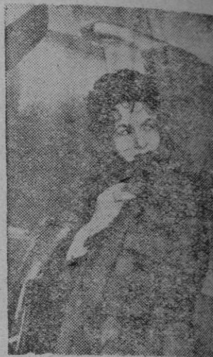
GINA LOLLOBRIGIDA interpretará el papel de Reina de Saba.

Mientras King Vidor rueda con sus huestes por los campos de Aragón, donde ha sido ambientado el pasaje bíblico, en los estudios está surgiendo la gran arquitectura de aquella época, con monumentales palacios y jardines, al aire libre. Ante este maravilloso espectáculo le cuesta a uno poco imaginarse el ambiente de aquel tiempo.