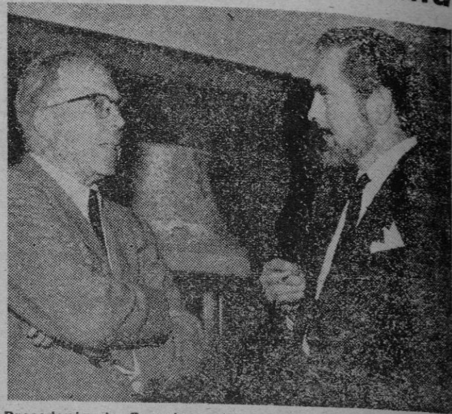
Procedente de Barcelona, hoy es esperado en Palma el famoso astro de la pantalla Tyrone Power. Viene en su vate «Cisne negro», acompañado de su esposa actual, Debbie Anne Minerdo, con la que se casó el pasado mes de enero. El celebrísimo «Ty», que como se sabe ha venido a España para filmar la película «Salomón y Sabán», (y de la que en nuestra página de reportajes damos interesantes detalles) se propone pasar varios días en Mallorca. En la foto vemos al gran actor, barbado, con el no menos famoso director King Vidor, durante la conferencia de prensa celebrada en Madrid. ¡Enhorabuena, jovencitas!