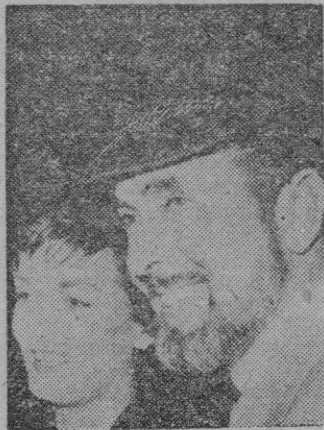
TYRONE POWER con la barba, a su llegada a España para filmar la película "Salomón y Saba".

Los cincuenta vagones que partían de Madrid transportaban