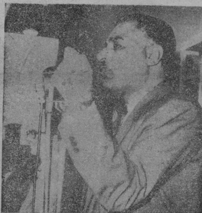
Damasco. — Después de su visita a Tito y de su inesperado viaje a Moscú para entrevistarse con Krushev, el presidente Nasser, desde el balcón de la Casa del Gobierno de Damasco, se dirige al pueblo sirio.

La caricatura del día porque resume bastante bien el sesgo norteamericano la imprime hoy el diario "New York Post" en cuyo dibujo político se ve al jefe del Gobierno inglés, MacMillan con mucha prisa tirando de un brazo a Foster Dulles y tratando de meterle casi a rastras en el ascensor de la ONU y a lo que el Secretario norteamericano se resaca... Por otro lado las reacciones populares y los comentarios periodísticos son así y anoto algunos: «Ya va a tener lo suyo que el de embarco de los fusileros de marina en el libano finalice con el de embarco de Krushev en Nueva York». El insondable Krushev de pie aquí un confuso sentimiento popular donde se mezcla la aversión con una cierta dosis de asombro casi admirativo hacia su cinismo o su dinamismo. «El póker apaga todos los faroles», comenta hoy el norteamericano medio por lo co-