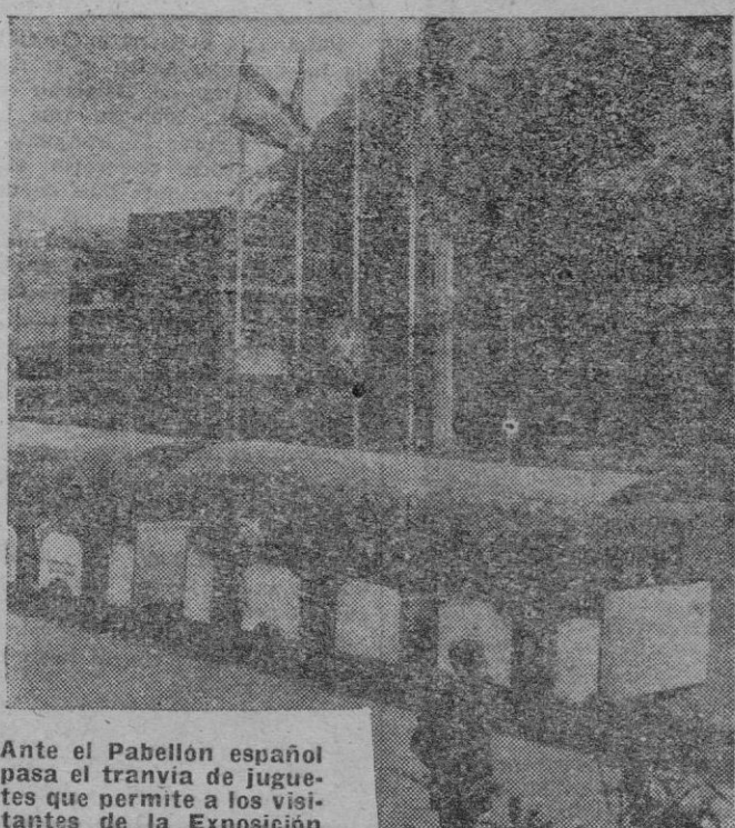
Ante el Pabellón español pasa el tranvía de juguetes que permite a los visitantes de la Exposición de Bruselas echar una rápida mirada de conjunto al magno certamen. Pronto empezará la Semana española. Con tal motivo se desplazarán a la capital belga importantes representaciones de nuestro país.