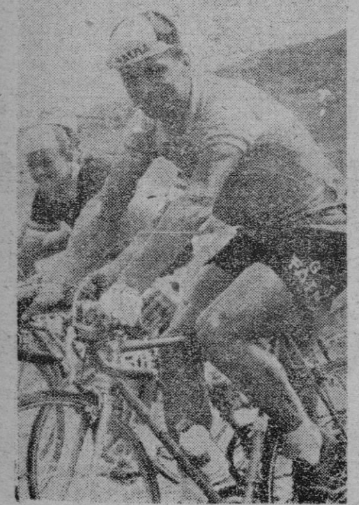
RIK VAN LOOY durante la Vuelta a España

Lo mismo puede decirse de los cinco y diez kilómetros. Estoy seguro que en este momento contamos con media docena de hombres capaces de figurar sin des-