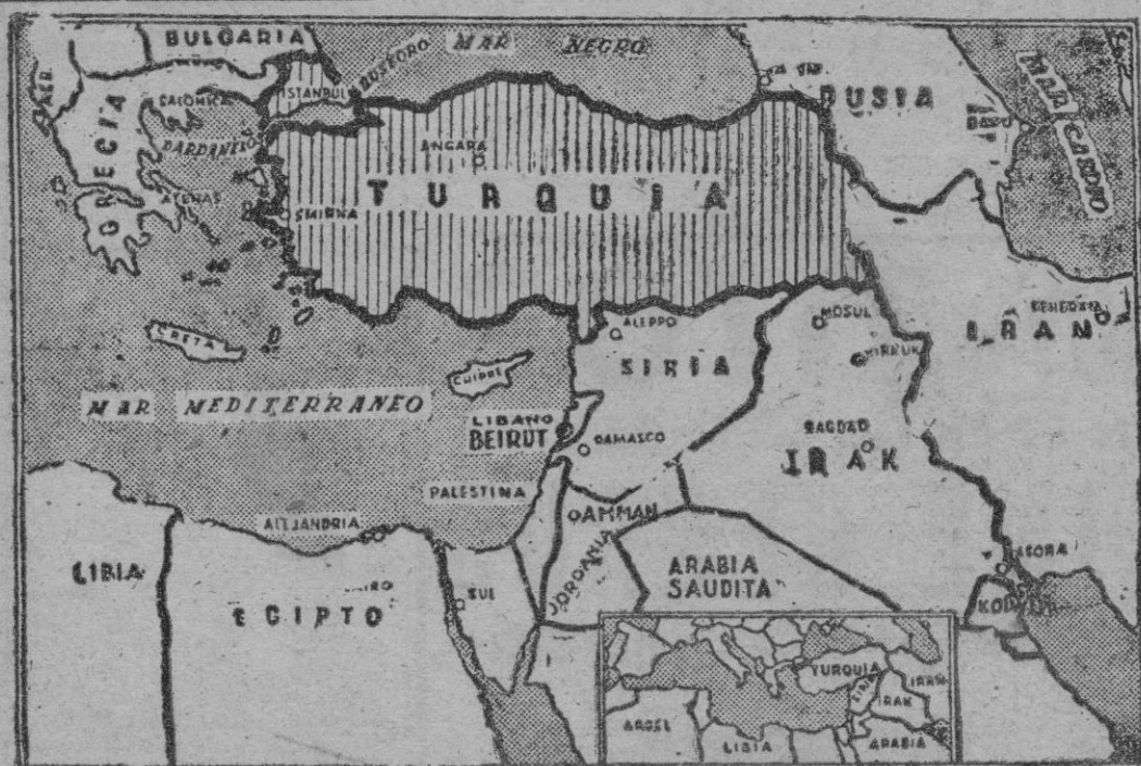
En este mapa hallará el lector orientación para situar geográficamente los recientes acontecimientos del Líbano y del Irak, en relación con los demás países fronterizos. En la reducción vemos al Oriente Medio en el conjunto de la cuenca mediterránea.

PROPUESTA RUSA: RETIRADA DE LAS TROPAS DESEMBARCADAS; PROPUESTA NORTEAMERICANA: RELEVO DE SUS TROPAS POR UNA FUERZA INTERNACIONAL