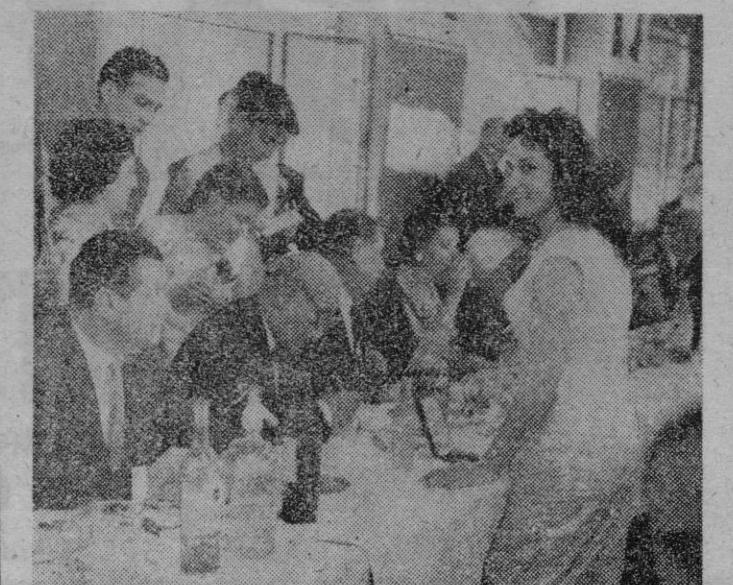
Madrid. — Con motivo de celebrar sus bodas de oro con la tauromaquia, le ha sido dedicado un fervoroso homenaje a Manuel Mejías «Bienvenida». Aquí vemos al famoso «Papa Negro» de la tauromaquia firmando autógrafos a solicitud de un grupo de admiradores y gentiles admiradoras.