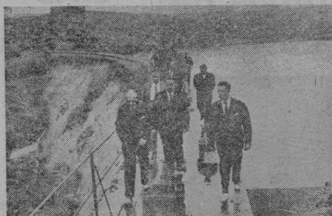
Durante su reciente viaje a la provincia de Avila, el Ministro de Obras Públicas, señor Vigón, inspeccionó diferentes obras de su Departamento. En la foto vemos al Sr. Ministro, acompañado de personalidades y técnicos, durante su visita a la presa de Becerril.