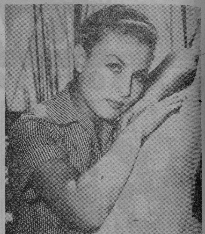
La gran estrella del cine español, Lolita Sevilla, cuyas últimas películas estrenadas en Palma, han puesto de manifiesto sus excepcionales dotes de estrella de la canción, se presentará mañana, noche, en «Madrigal», la hermosa terraza de Camp de Mar. Como quiera que sus contratos le impiden permanecer en Palma más tiempo, sólo podrá actuar el jueves y viernes.