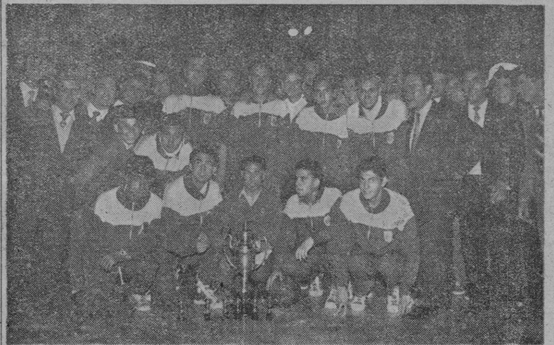
El «Obras del Puerto» de Alicante, vencedor en la Fase de Sector