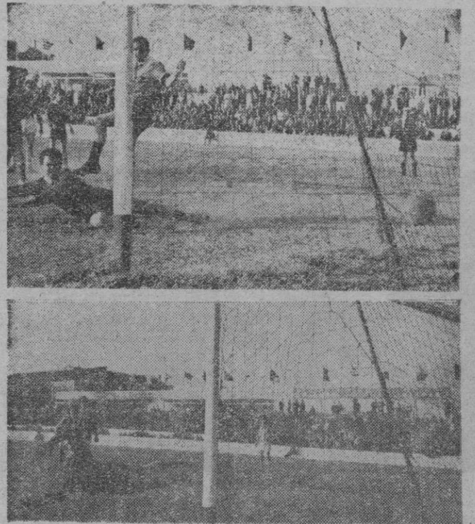
Dos de los magníficos goles logrados por el Atlético Baleares frente al Binisalem