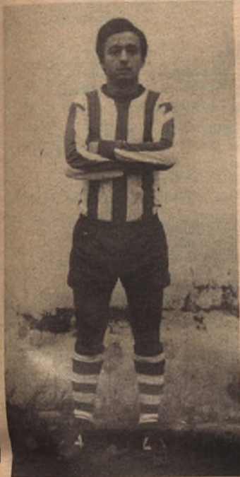
ZABORRAS (At. Huesca)

"ASPIRO A SER ESTA TEMPORADA EL MAXIMO GOLEADOR DE LA 1ª REGIONAL"