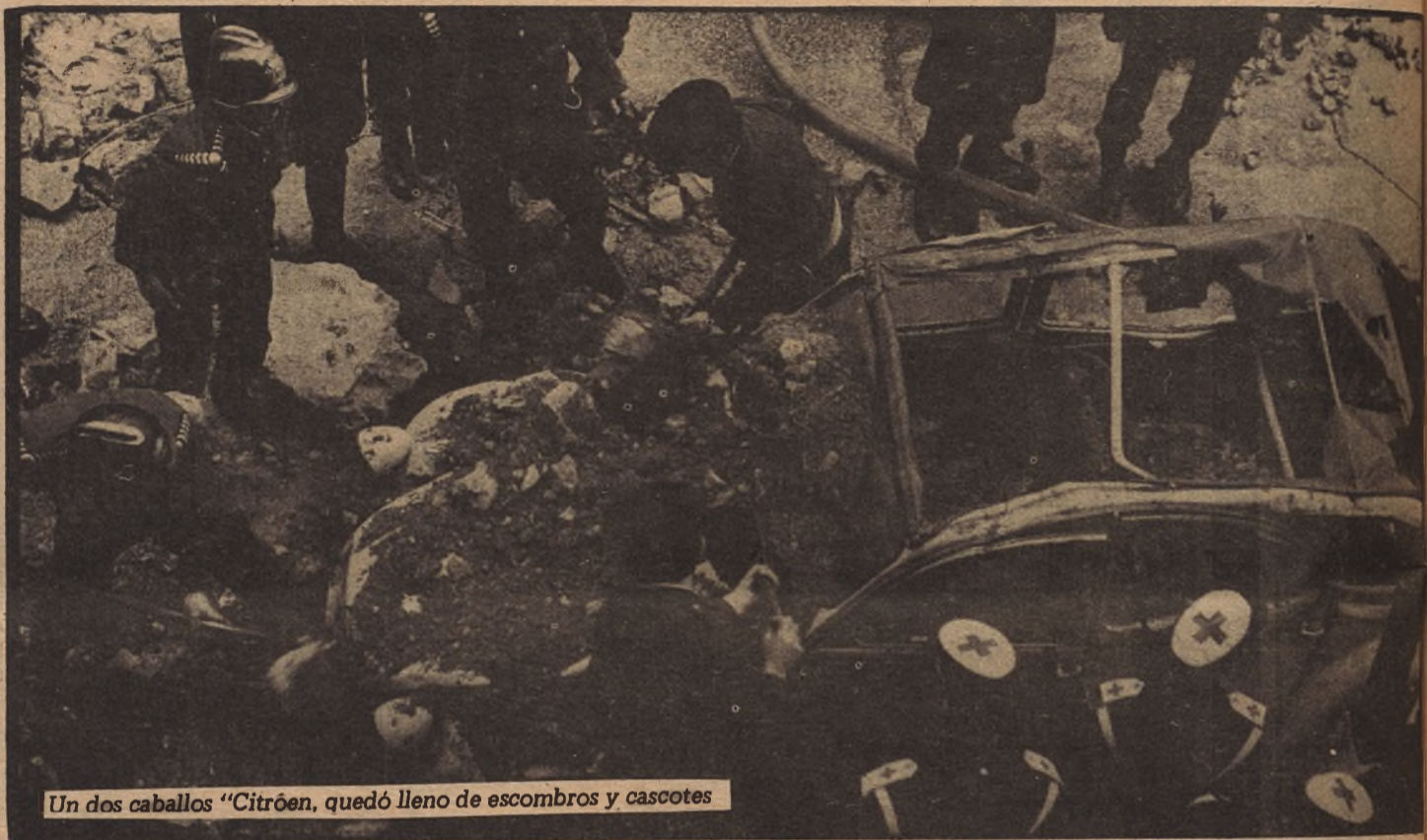
Un dos caballos "Citroën, quedó lleno de escombros y cascotes

Aunque hasta las trece horas no se comunicó oficialmente que se "había producido una importante explosión" en una calle del barrio de Salamanca, la noticia se había propagado aquí por doquier como un reguero de pólvora. Llovía en la ciudad. Una mañana de oscuros y trágicos grises. Desde el primer momento la intención y la perspicacia de la gente hizo que comprendiera, aunque el Gobierno quiso, tras asegurarse de la naturaleza del accidente, darlo después gradualmente, que la importante explosión era algo más, muchísimo más. Unas horas más tarde, casi no había duda: se trataba del más vil, bajo y ruín de los atentados.