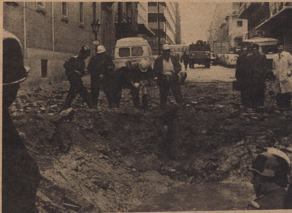
Los bomberos estuvieron desde el primer instante achicando agua