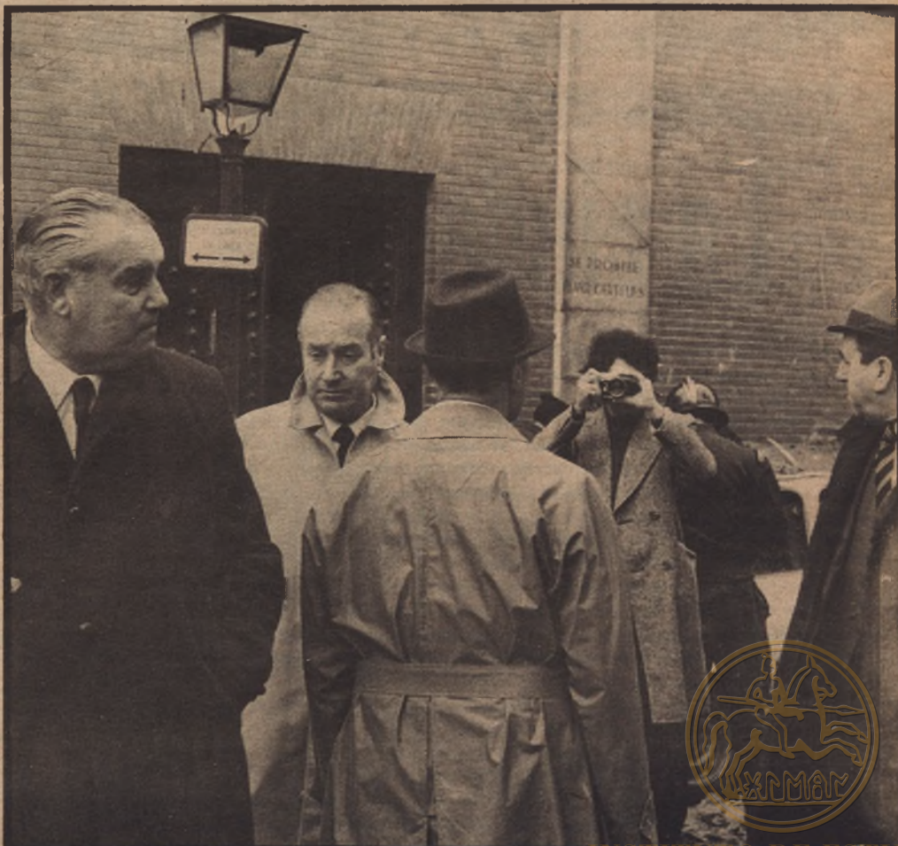
Justamente aquí se produjo la terrible explosión que dejaría fulminado el automóvil del Almirante Carrero Blanco en cuyo trágico atentado perdió la vida.

"El país ha visto, sin embargo, con serena confianza cómo los mecanismos políticos funcionan con saludable normalidad y el Vicepresidente del Gobierno sucede inmediatamente al Presidente fallecido, de acuerdo con lo dispuesto en la Ley Orgánica del Estado. Las instituciones que el ayudó a crear, en su tarea de gobernante a las órdenes del Caudillo, son las que están ahora funcionando. Esta es la mejor garantía de que el edificio político, en el que tanta parte tuvo don Luis Carrero Blanco, está sólidamente fundado. En la continuidad del funcionamiento de ese mecanismo institucional se apoya precisamente la mejor esperanza de brillante futuro por el cual el Almirante Carrero Blanco ha ofrendado su vida. Por ello, hoy el pueblo une a su dolor la gratitud."