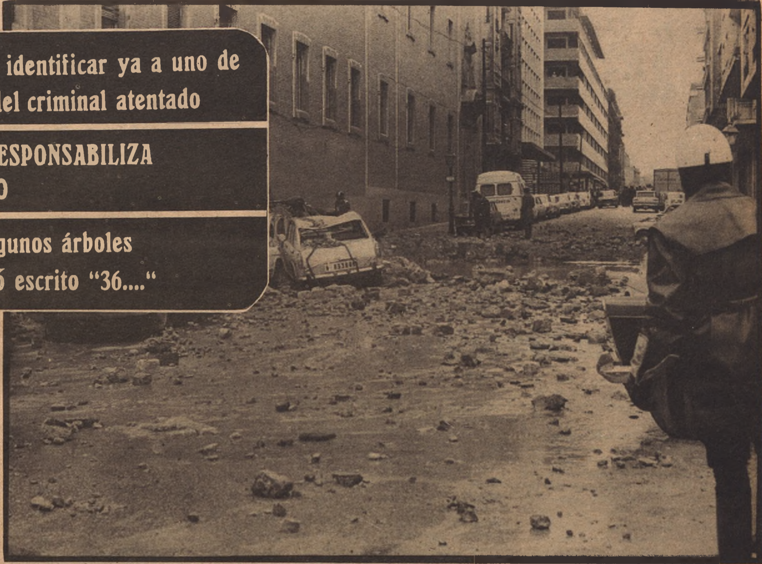
Aspecto desolador y terrible de la calle Claudio Coello.

Y para terminar un brevísimos comentario: esta mañana en los troncos de bastantes árboles de Madrid ha aparecido pintado, con pintura negra, la cifra treinta y seis y suspenso (36...)